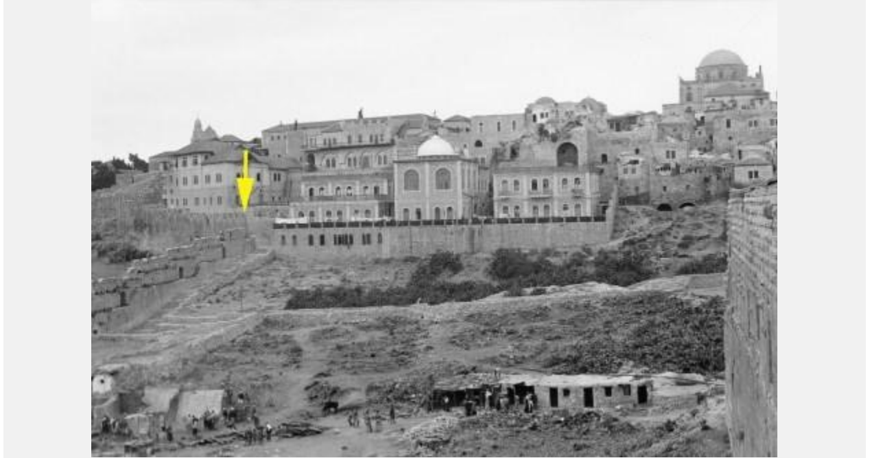
1935年前后，靠近穆格拉比区的犹太区。老城城墙和粪厂门在它的左边。图中有波拉特·尤塞夫神学院即塞法迪中东犹太人神学院(图中白色圆顶的建筑)和 Tiferet Yisrael 犹太教堂(右侧有穹顶的建筑)。注意用黄色箭头标出的墙角。就是下面图中标记的那个角。 10