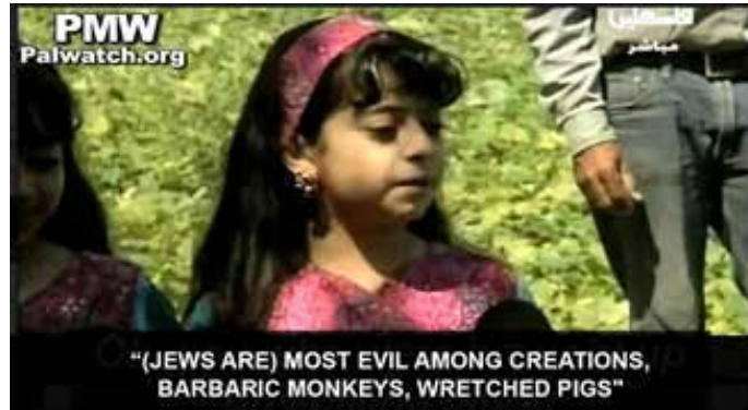
巴勒斯坦公共电视频道 2013年7月3日 “（犹太人）大多数都是很狡猾的人，他们是野蛮的猴子、可怜的猪”

巴勒斯坦官方电视台的‘教育’节目经常讨论解放整个‘巴勒斯坦’这个‘终极目标’并否认以色列的生存权，呼吁巴勒斯坦年轻人牺牲自己的生命来实现这个‘光荣使命’，以及杀死犹太人。