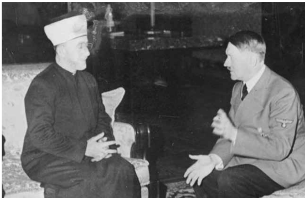
1941年，在柏林，阿道夫·希特勒接待了大穆夫提哈吉·阿明·侯赛尼

在第二次世界大战期间，与德国纳粹领导人关系密切的侯赛尼，每天在柏林广播电台用阿拉伯语进行一小时广播，宣传纳粹、反对犹太人和盟军。