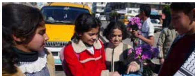
2008年2月4日，以色列发生自杀性袭击事件，巴勒斯坦儿童高兴地四处发糖庆祝！

像烈士一样死去 我们像烈士一样牺牲，就会升入天堂。 不要说我们还小；生命至此，我们已是成人。 没有巴勒斯坦，何来我们的童年？ 即便给了我们整个世界，也毫无意义。 不，我们不会忘记我们的祖国。 我的祖国，我的鲜血为你而流。 没有巴勒斯坦，何来我们的童年？ 孩子们啊，你履行了自己的宗教义务。 世界上没有上帝，只有安拉。 烈士就是上帝的宠儿啊！ 你教会了我们成年的意义。 安拉！你保护了伊朗，保护了穆斯林啊！ 安拉，求你救一救巴勒斯坦的孩子们吧！