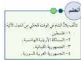
五年级古文明历史教科书 (2004年) 第30页