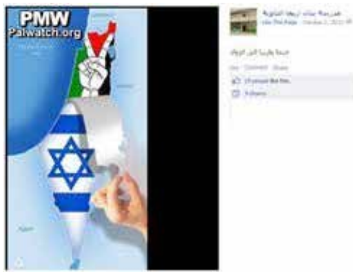
杰里科女子高中社交网站脸书的主页 2012年10月2日