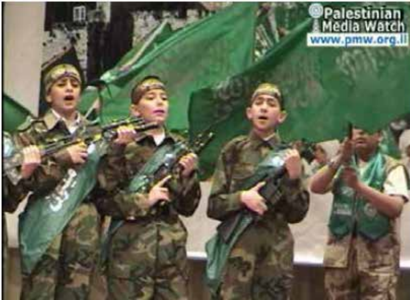
加沙地区的夏令营

巴勒斯坦的教科书和官方儿童电视节目都大量充斥着对犹太人的抵制和否认以色列存在的例子。