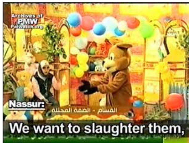
出现在哈马斯儿童电视节目上的小熊公仔纳苏尔 2009年9月22日 “我们想要杀死他们，”