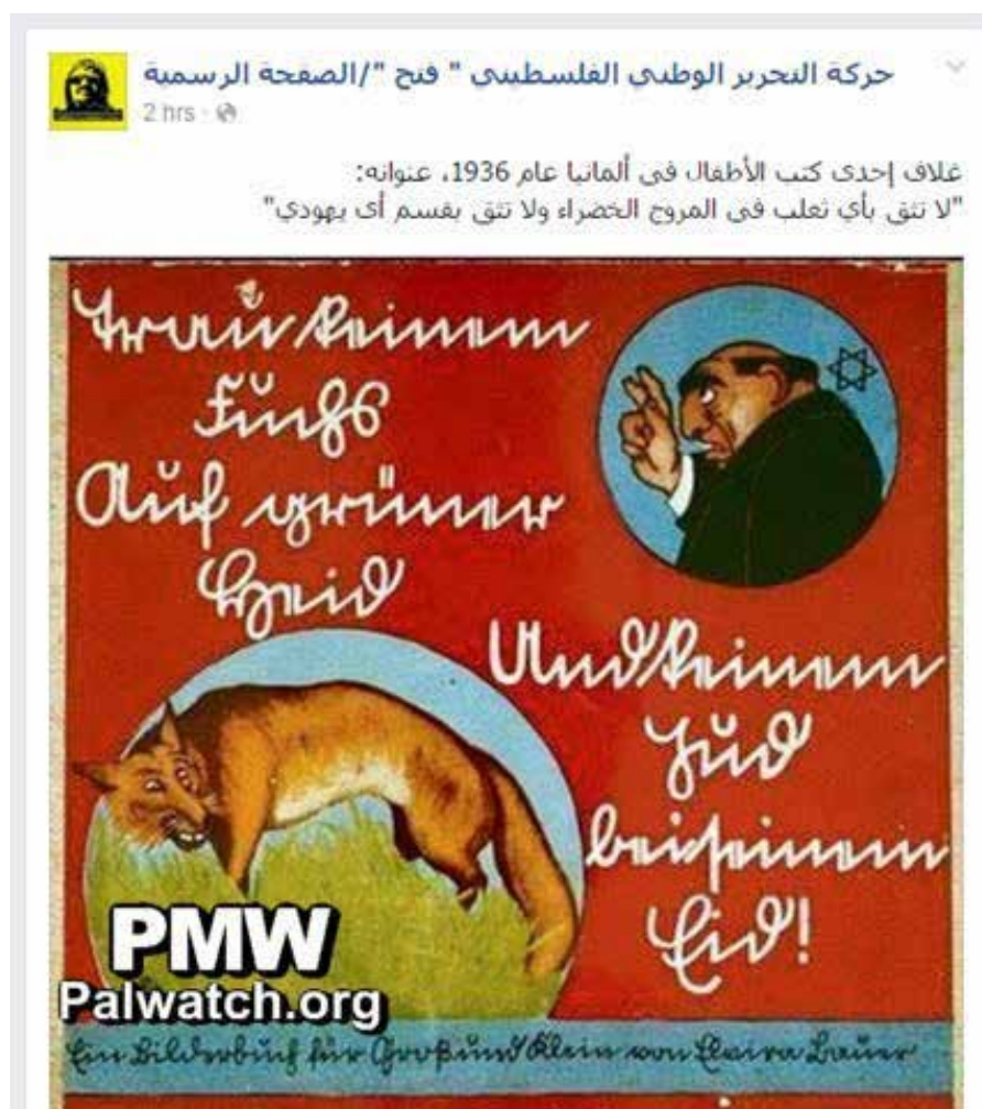
法塔赫运动的官方社交网站脸书主页，2015年10月29日

七十年后，巴勒斯坦执政党法塔赫在其官方社交网站脸上刊登了1936年纳粹德国儿童图书的封面，显示了当时它和纳粹宣传的密切联系。文本翻译为“…不要相信任何一个犹太人”。